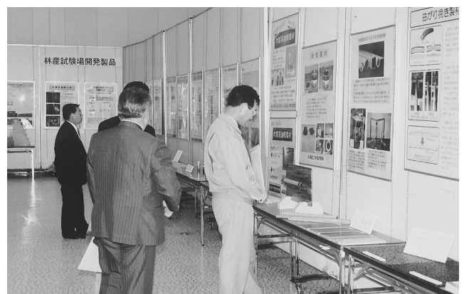
写真1 林産技術交流プラザにおける展示会風景 (2000.5.18 釧路市にて)

ちなみに、展示会と技術交流会は「成果の普及と技術移転の促進」に該当し、懇談会は「研究ニーズの掘り起こしと把握」に該当します。そして、技術相談室と