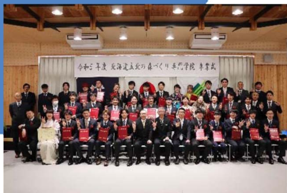
令和5年度卒業式 (北森カレッジニュースより)