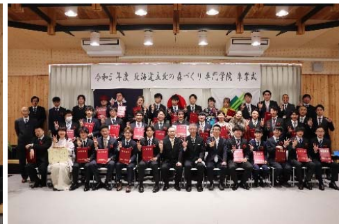
【卒業生の集合写真】