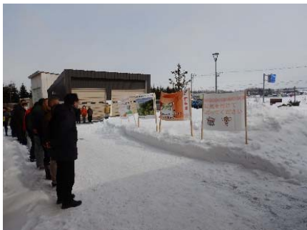
【林産試験場職員からのエール】

この度の無事の卒業に至り、全道各地の自治体や企業・関係団体のみならず短期就業体験実習や長期就業実践実習、地域見学実習の対応など多大なご支援とご協力をいただきました。この場をお借りして厚くお礼申し上げます。