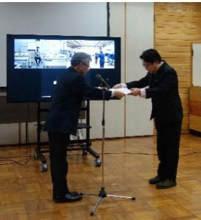
【総務部総務課主任】