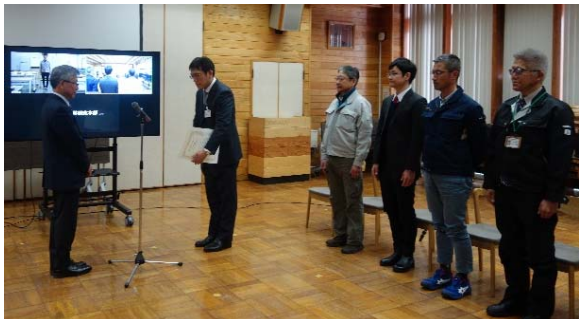
【木質粗飼料開発チーム】 講堂 5名, オンライン 1名参加

3月18日、7名（二組）の森林研究本部職員が令和5年度（地独）北海道立総合研究機構森林研究本部長表彰を受けました。一組目は、道内産業の振興・発展に貢献した「木質粗飼料開発チーム」の6名です。二組目は、道総研のコンプライアンスの確立に貢献した総務部総務課主任の1名です。