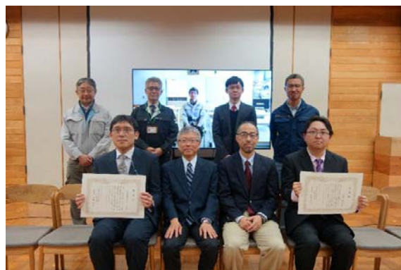
森林研究本部長表彰 (林産試ニュースより)