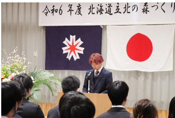
【新入生代表の挨拶】

これからは授業と実習の日々になり本格的な学校生活が始まります。5期生31人が仲間たちと共に切磋琢磨し合い、2年後には林業・木材産業の担い手として道内各地に羽ばたいてほしいと思っています。