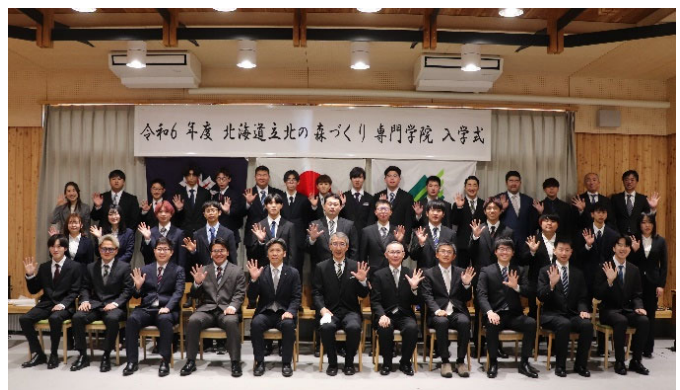
【新入生の集合写真】