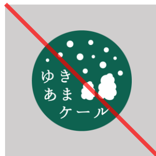
外周の記載事項を 削除する