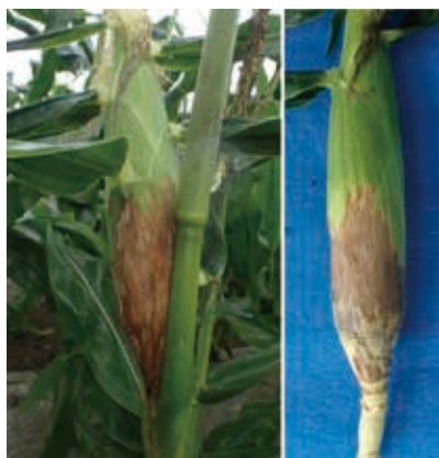
写真1 褐色腐敗病の発生雌穂

2013～2014年は中央農試および現地圃場で、2015年は中央農試で行った。供試品種は2013～2014年の中央農試では「味来390」を2015年の中央農試および現地試験は「味来早生130」を供試した。薬剤散布月日は表1に示した。薬剤は背負式動力噴霧器を用い、150L/10a散布した。供試薬剤については表2に示した。なお、散布薬液には展着剤としてポリオキシエチレンノニルフェニル