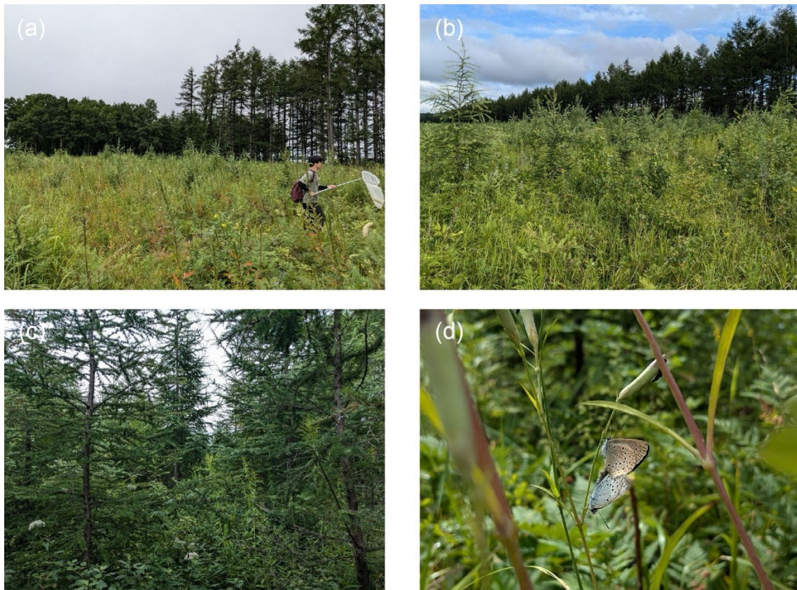
図 2 調査地の風景。 a, 2 年目の植林地; b, 5 年目の植林地; c, 9 年目の植林地; d, 6 年目の植林地で交尾する準絶滅危惧種ゴマシジミのペア。なお、a に写った男性は第三著者。