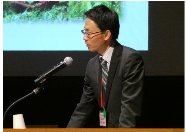
写真 5 [口頭発表] 植栽木周辺の雑草木がトドマツおよびカラマツ類の生残と成長に与える影響：3 シーズンの結果