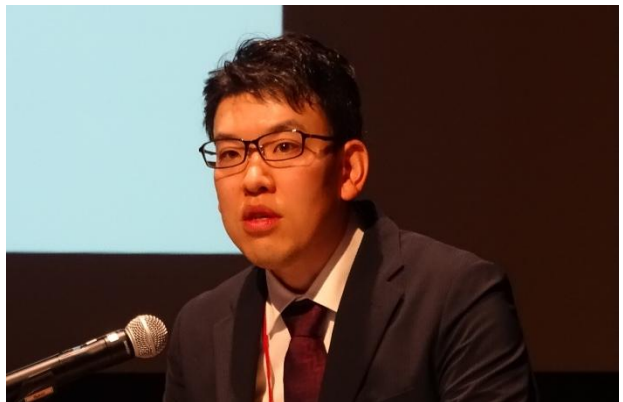
写真3〔口頭発表〕新しい計測技術による森林資源量把握技術の実用化について