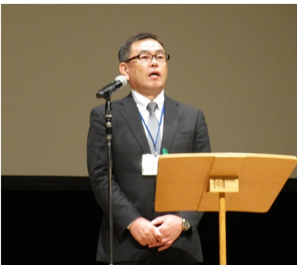
写真 7 林産試験場長による閉会あいさつ