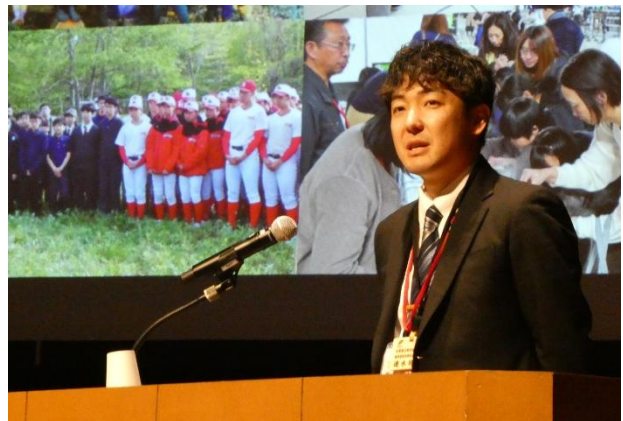
写真2〔口頭発表〕気候変動・野生動物リスク下で進めるネイチャーポジティブな防風林管理の普及実装