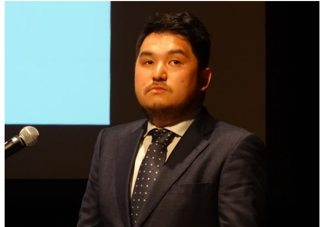
写真 4 [口頭発表] 衛星画像を用いた北海道全域の天然林資源情報把握手法の開発

次のページより、林業試験場のポスター発表全 10 課題を紹介していますので、ぜひ御一読ください。