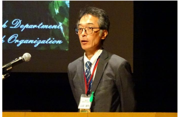
写真1 森林研究本部長より発表概要を説明

午後からの道総研森林研究本部の部（林業試験場・林産試験場）では、「森林の役割と森からの恵み」と「森林資源循環利用のために」の2テーマに沿って、口頭発表10課題、ポスター発表27課題の計37課題の発表を行いました。口頭発表では、近年、生物多様性や自然環境の損出を止め、回復軌道に乗せる国際的な概念であるネイチャーポジティブをキーワードにした防風林管理に関する取組事例や、今後、利用拡大を見込むクリーンラーチの優良種子の増産技術、森林調査業務の高精度化と省力化を目指したUAVを活用した研究事例、初期保育において重要な課題である下刈作業の省力化に向けた研究事例などを紹介し、来場者から多くの質問が寄せられました。