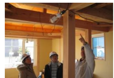
継続的な普及指導活動