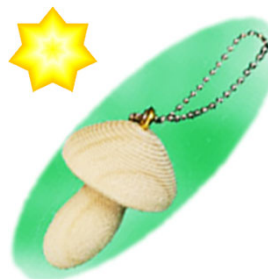
【きのこストラップ】

昨年9月15日（火）～10月15日（木）、（一社）北海道林産技術普及協会および北海道立北の森づくり専門学院との共催で実施しましたWeb版「木になるフェスティバル」は、おかげさまで多くの皆様にご参加いただきました。クイズの景品「きのこストラップ」を手に入れた皆様には、ぜひ、末永くご愛用いただけますようよろしくお願いいたします。