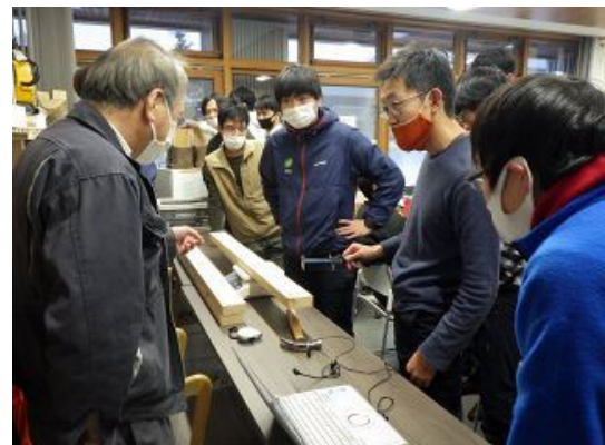
【ヤング係数の計測実習】