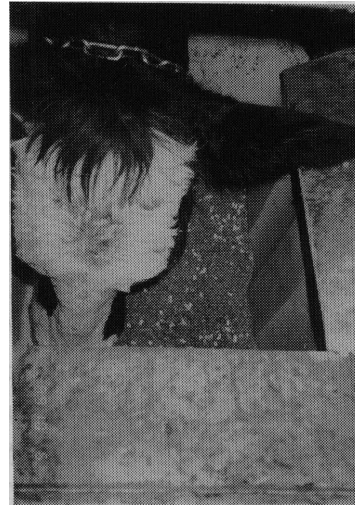
木質飼料による飼育試験

木材の主成分であるセルロースは、ブドウ糖が数千個あるいは一万個以上も直線上につながった構造をしています。ブドウ糖からできていることではデンプンと同じです。ただブドウ糖のつながり方が両者で若干異なります。そのためデンプンとセルロースではブドウ糖まで分解するための酵素が違います。セルロースの分解酵素はセルラーゼ、デンプンはジアスターゼといいます。多くの高等動物はセルラーゼを持っていないのでセルロースを消化することができません。しかし、牛、山羊、鹿、キリンなどの反芻動物は、胃の中にセルラーゼを持った微生物が共生しているのでセルロースを消化してエネルギー源として利用することができます。ですから、主成分がセルロースである木材を牛などの反芻動物のえさとして利用することができるわけです。